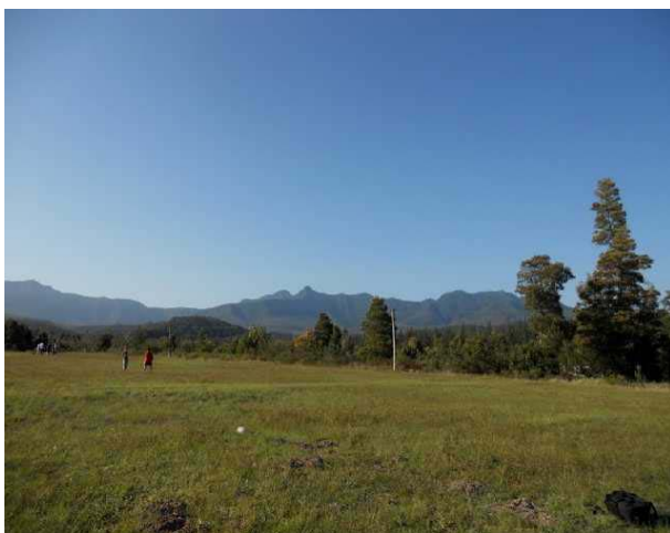
Het land van Karatara opnieuw biddend in bezit genomen met het hele team

Paulus' roemen is in Christus Jezus ; het is op Hem gericht ; het erkent ten volle dat alle ideale eerbetoon dat gedaan wordt, uit Hem is voortgekomen; het is te danken aan de in Hem zijnde genade. Het is belangrijk dat we gaan erkennen dat alle dienstbetoon dat bruikbaar is voor God, door ons bewerkt zal worden door Jezus Christus , niet door onze eigen wijsheid en kracht. Zie voor twee gelijksoortige getuigenissen naar 1 Kor. 15:10 en Fil. 3: 8-9.